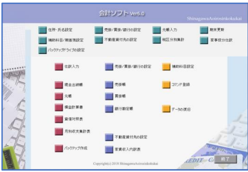
ブルーエイトの画面です